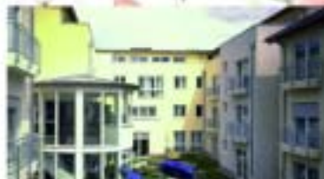
Alten- und Pflegeheim St. Martin

Schulstraße 2a, 56743 Mendig Telefon: 02652 9346-0, E-Mail: info@altenheim-marienstift-mendig.de