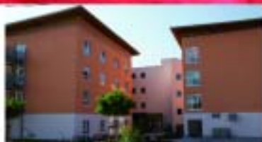
Alten- und Pflegeheim Marienstift

... so wäre es vielleicht, dass weder Ihre Liebsten noch Sie selbst alleine alt werden müssen. Wie schön wäre es, gut aufgehoben zu sein, bei Bedarf liebevoll gepflegt und mit allem versorgt zu werden, was ein Altern in Würde ermöglicht. Was alleine kaum zu schaffen ist, gelingt mit gemeinsamen Kräften, ganz nach Ihren Bedürfnissen, ob in Langzeit-, Kurzzeit- oder Tagespflege.