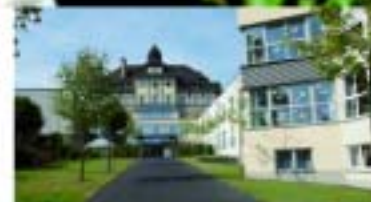
Alten- und Pflegeheim Marienburg

Heinrich-Heine-Str. 7-11, 56299 Ochtendung Telefon: 02625 9587-0, E-Mail: info@altenheim-st-martin.de